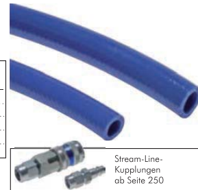
Stream-Line-Kupplungen ab Seite 250

Kits und Sets zusammenstellen! Sparen mit fertigen Kits, Sets mit Schlauch, Fittings, Ausblaspistolen! Gerne erledigen wir das für Sie!